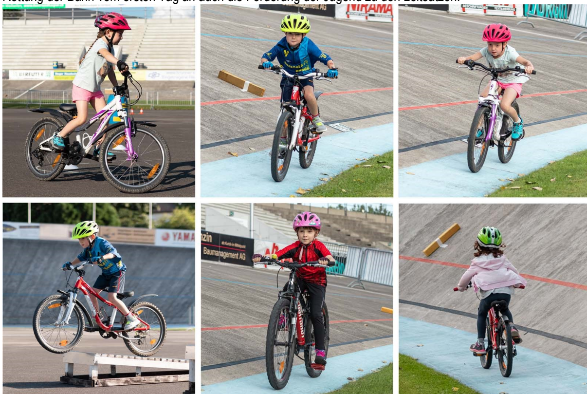
Bahn frei für die Marvullis von morgen – jetzt anmelden!

Ohne Nachwuchs und ohne Bahn gäbe es in Zukunft keine jungen Küblers, Koblets, Buchers, von Bürens, Freulers, Dill-Bundis, Risis, Marvullis, Imhofs oder Küngs mehr. Als sieben radsportbegeisterte Männer in einer Nacht und Nebelaktion 2002 die IGOR, die Interessen Gemeinschaft offene Rennbahn, gründeten, gehörte neben der Rettung der Bahn vom ersten Tag an auch die Förderung der Jugend zu den Leitsätzen.